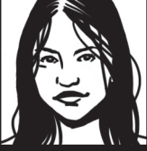
EVE Reine du Mal