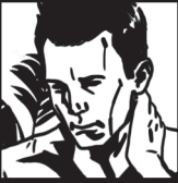
JOSHUA No Future