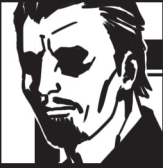
ADAM Meilleur Ennemi