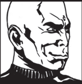
DEVO Sombre Illuminé